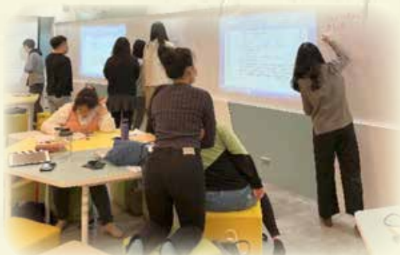
兒童心理特質與學習演講小組討論