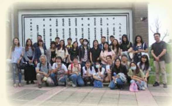
樟湖生態國民中小學參訪_大合照