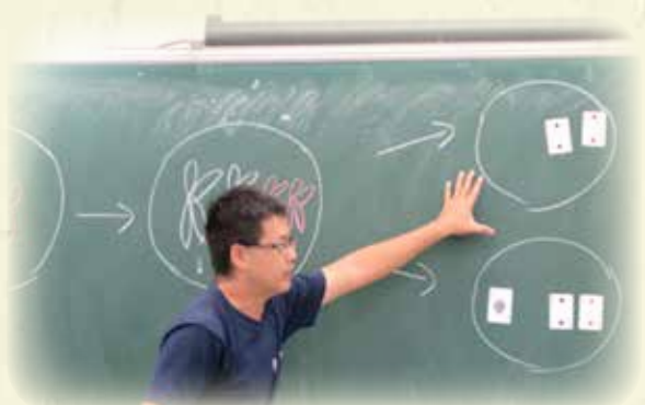
生物科實習學生教學演示