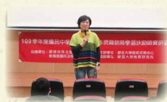
非現職教師學習扶助師資研習