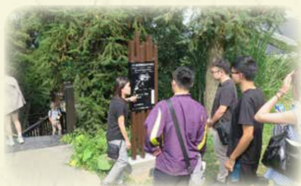
樟湖生態國民中小學參訪_校園解說