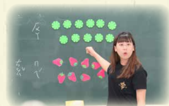
國民小學實習學生教學演示